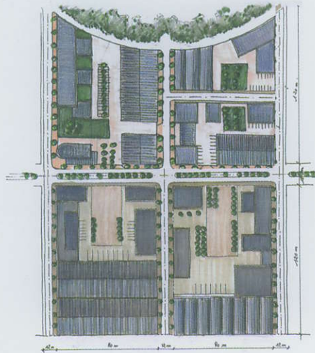
lots types – Activités